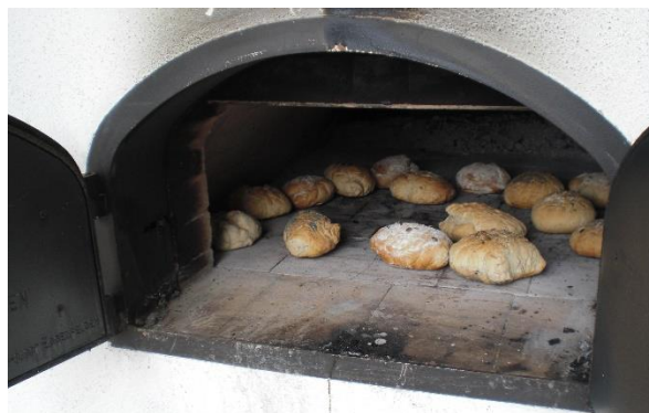
Brot backen im Riedmuseum

Vielfältig ist das Angebot unserer Museumspädagogik. Ob als Begleitprogramm zu den Sonder- oder Dauerausstellungen und der Ur- und Frühgeschichte, auch Kindergeburtstage können in den Städt. Museen nach Absprache gefeiert werden. Kindergärten und Schulen sind ebenso herzlich willkommen, buchbar auch außerhalb der Öffnungszeiten. Sie haben noch Fragen? Auf den verschiedenen Homepages sind die Flyer zu finden oder rufen Sie einfach bei uns an. Wir helfen gerne weiter.