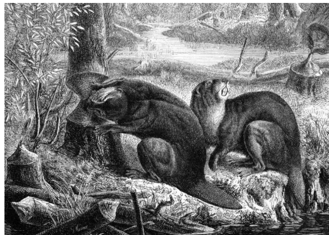
G. Hammer: Biber bei der Arbeit, Zeitschrift Gartenlaube, 19. Jh.

Im kurzen Monat Februar werfen wir jetzt schon einen kleinen Blick in den März und ins Riedmuseum: Zum Saisonstart am 1. März wird im Museum in der Scheune eine Wanderausstellung des BUND Ostwürttemberg zur Kulturgeschichte des Bibers gezeigt. Die Ausstellung ist im Museumseintritt inbegriffen und bis zum 19. April zu sehen. Zu der Ausstellung wird es ein Begleitprogramm geben, näheres im Newsletter März oder auf der Infokarte (in Papierform).