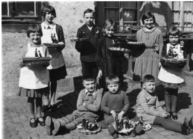
Rastatter Kinder, Ostern 1932 (aus dem Fotoalbum Fraß - Elsenhans)

Ostermontag, 21. April haben das Stadtmuseum und die Städtische Galerie Fruchthalle ab 11.00 Uhr und das Riedmuseum ab 14.00 Uhr geöffnet