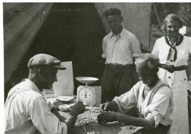
Goldwäscher in Au am Rhein, spätes 19. Jh.